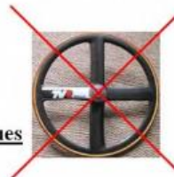
Type de Roues Interdites